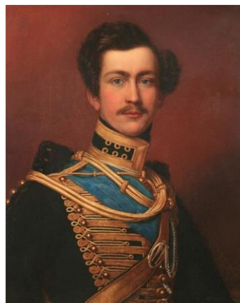
Портрет М. Лейхтенбергского в молодости Неизвестный художник.