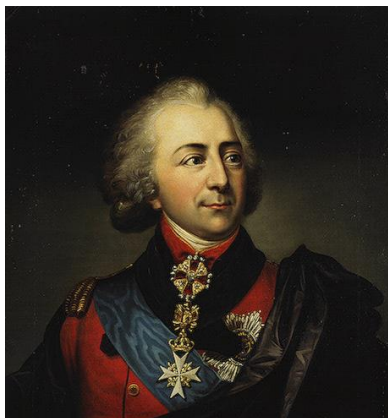
Портрет графа И.П. Кутайсова