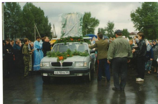
Крестный ход с иконой "Всех скорбящих радость"