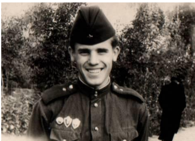
Дедушка на службе в рядах Советской Армии