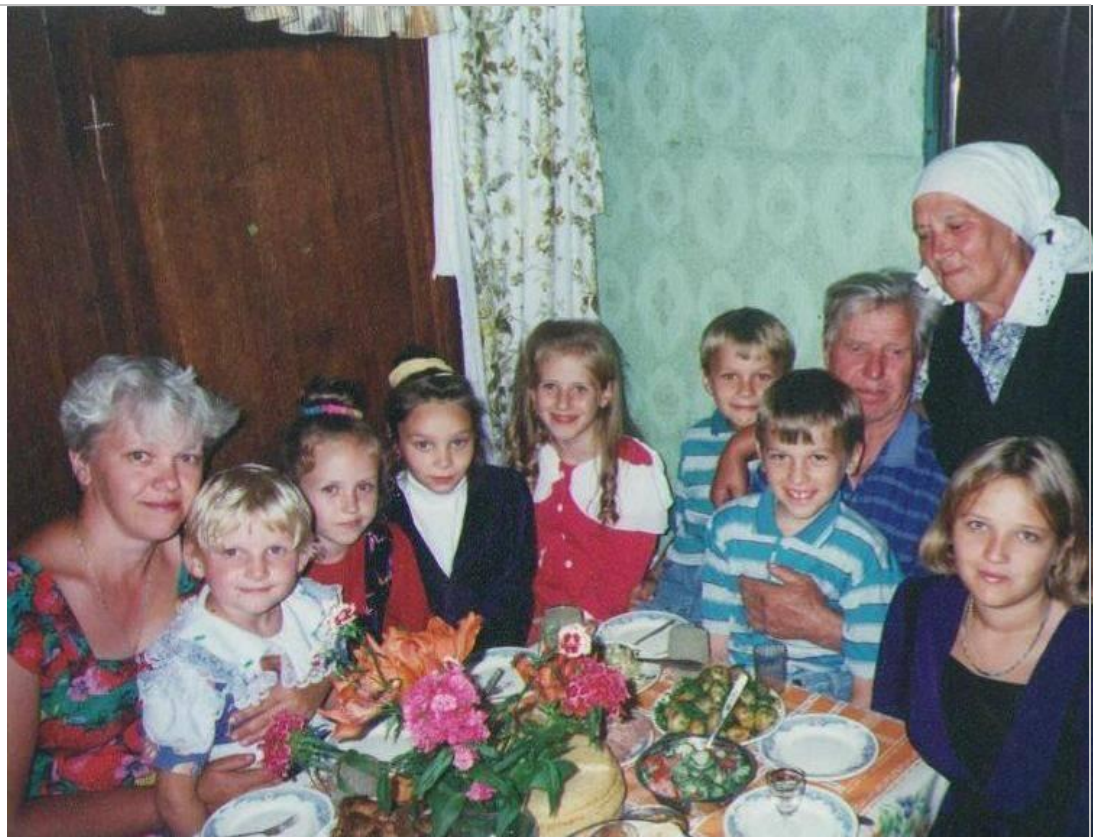
В кругу семьи