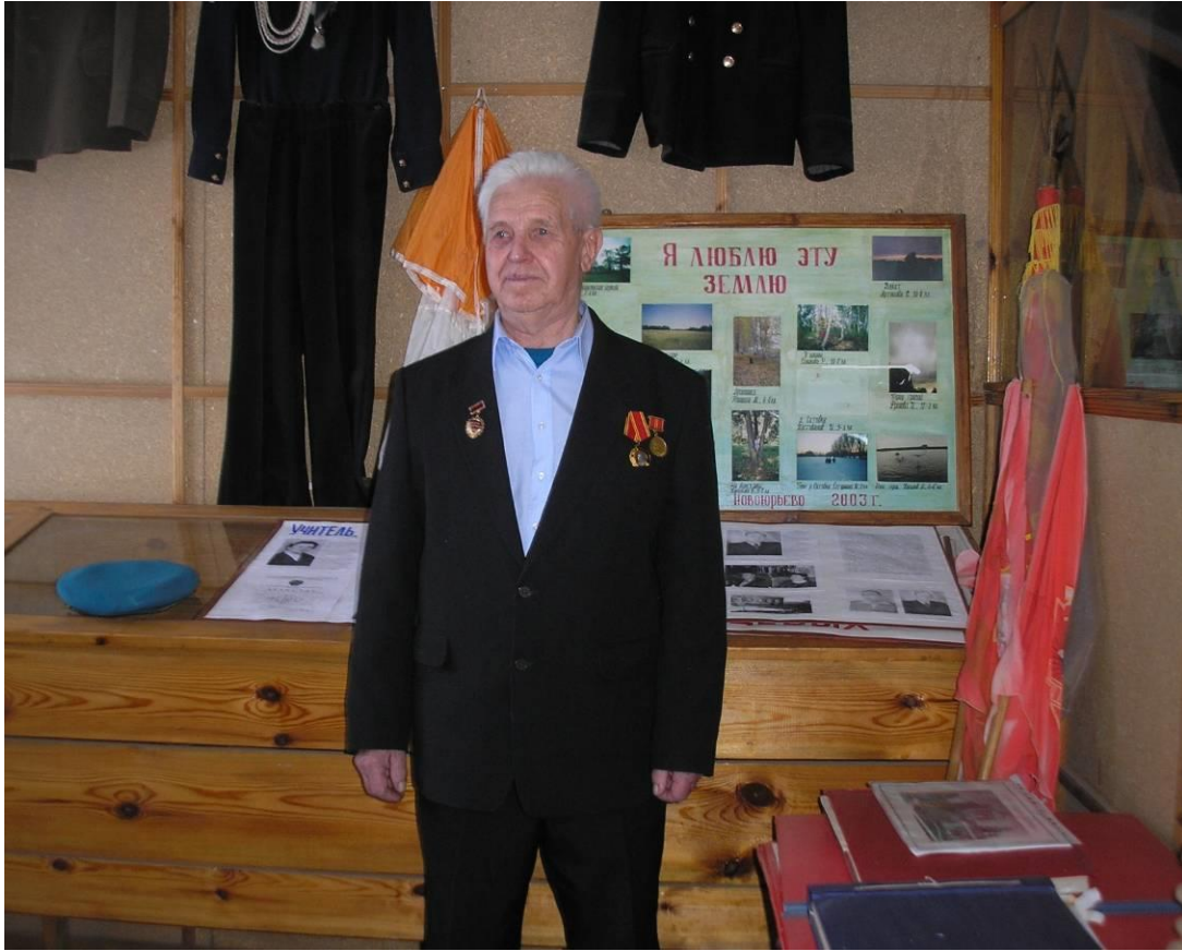
В школьном музее