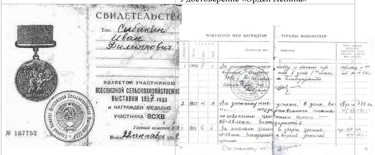
Свидетельство и медаль участника сельскохозяйственной выставки 1957 года