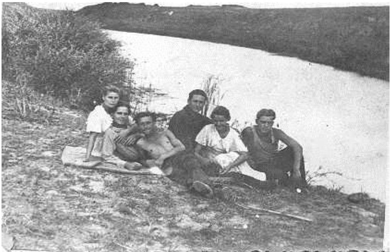
Во время отдыха