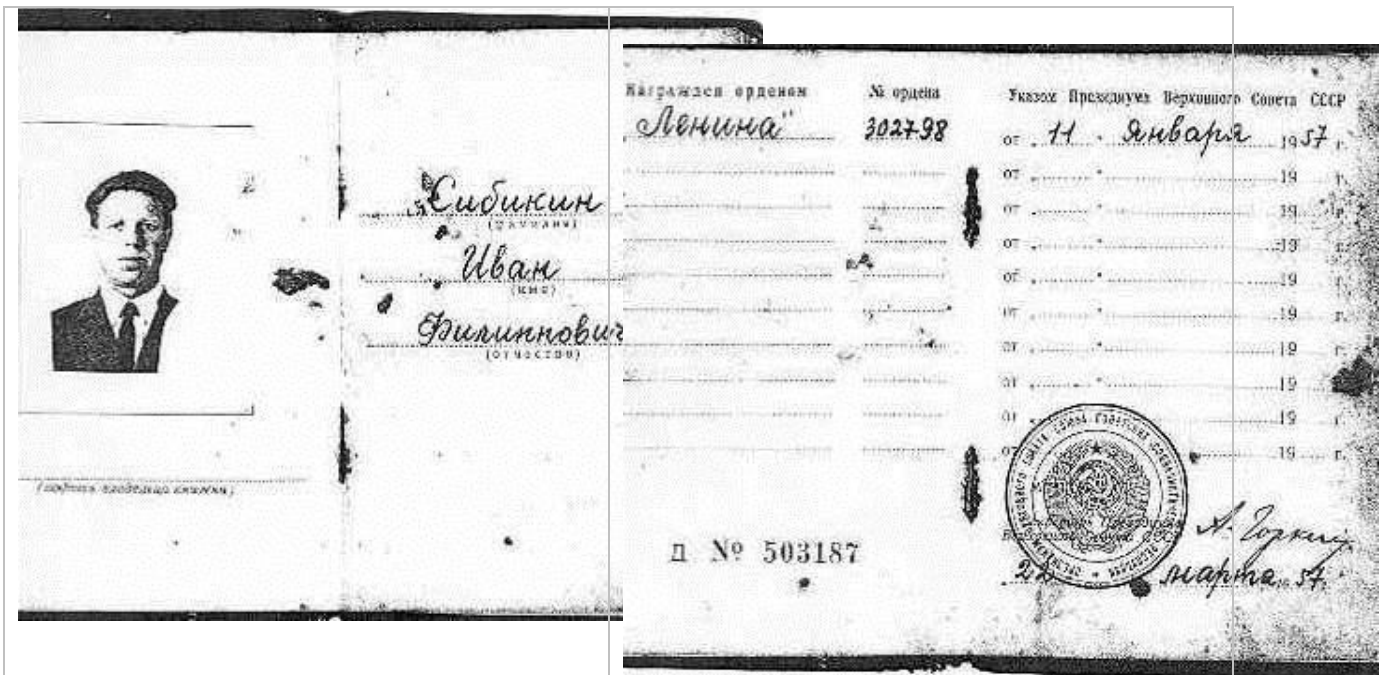
Удостоверение «Орден Ленина»