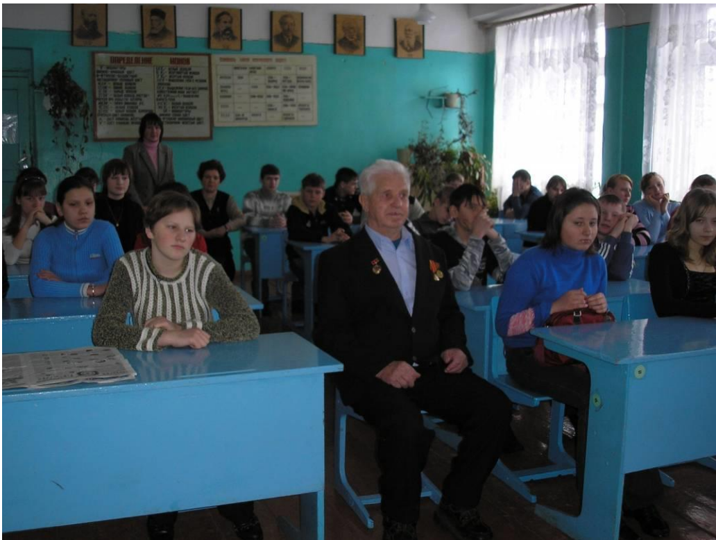
На классном часе