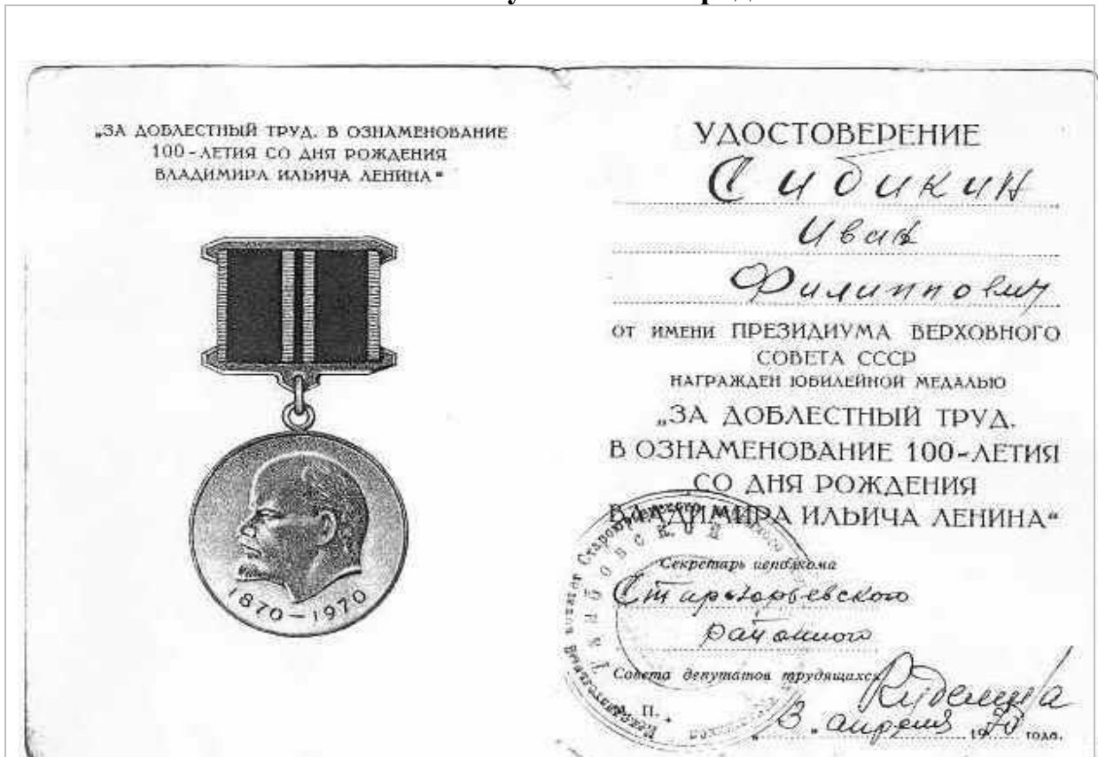
Медаль «За доблестный труд»