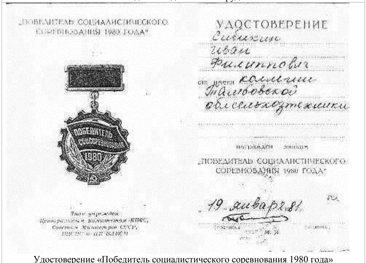
Удостоверение «Победитель социалистического соревнования 1980 года»